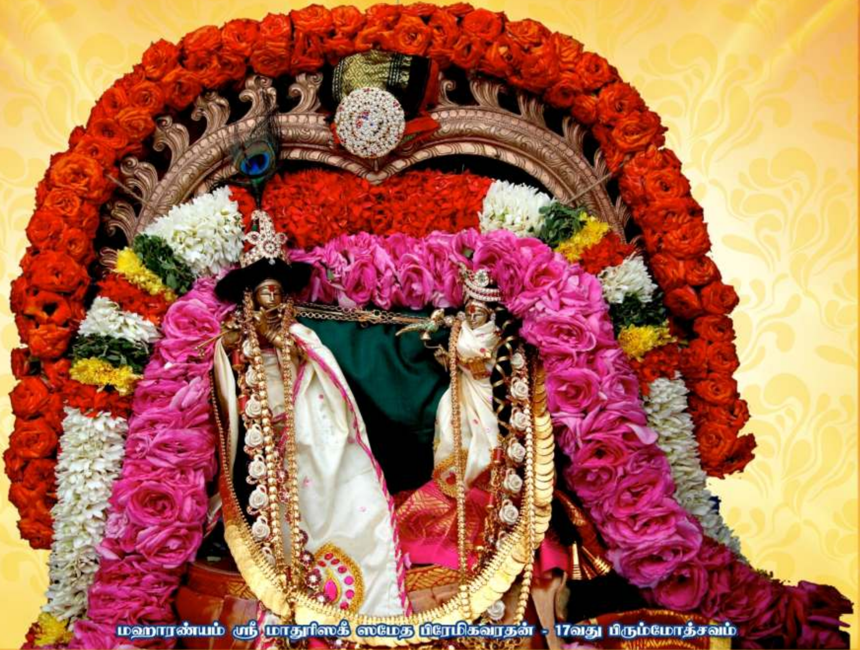
மஹாரண்யம் ஸ்ரீ மாதூரிஸக் ஸமேத பிரேமிகவரதள் - 17வது பிரும்மோத்சவம்