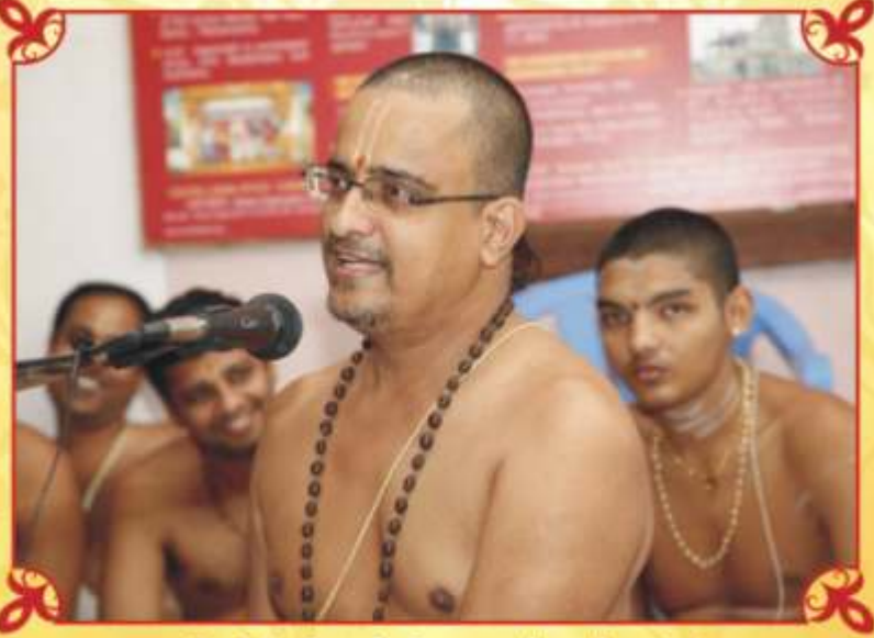
நகுஞ்சோதஸவத்தன்று - உபஸ்யாசம் - 7/9/2010