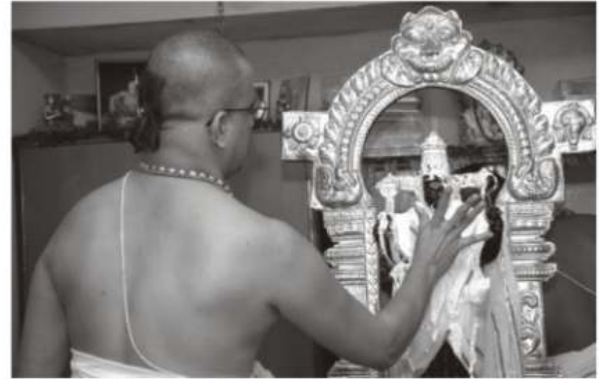
கோகுலாஷ்டக்யை முள்ளீட்டு, சென்னை ப்ரேம்கபலனக்தீல் ஸ்ரீஸ்வாச பெருமானுக்கு விசேஷ திருமஞ்சளம்