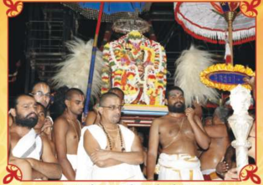
கருட வாக்றணம் - ஜய ஆஞ்சநேயர் ணன்னத்- 4/9/2010