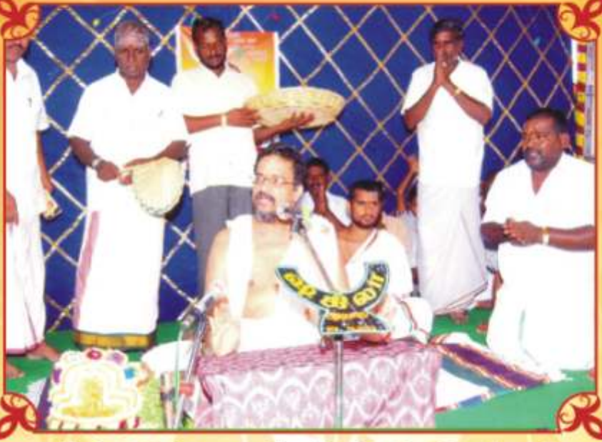
சுழியாத் தம் அருகே கே.வளசை க்ராம கோவில் சும்பாபீஷைகம் ஆகஸ்டு 22