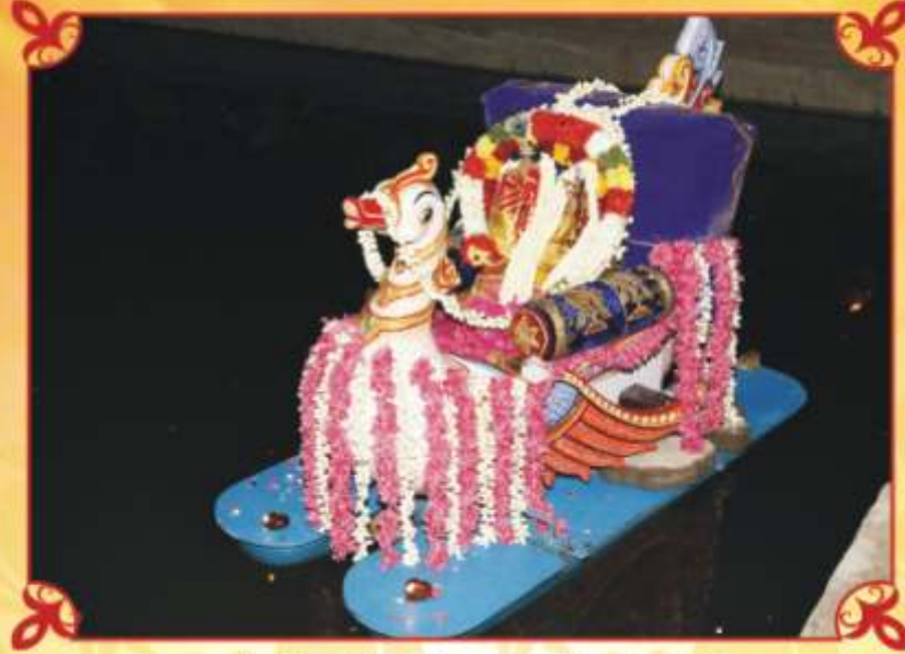
தெப்போத்ஸவம் - அன்னவாஹணம் - 9/9/2010