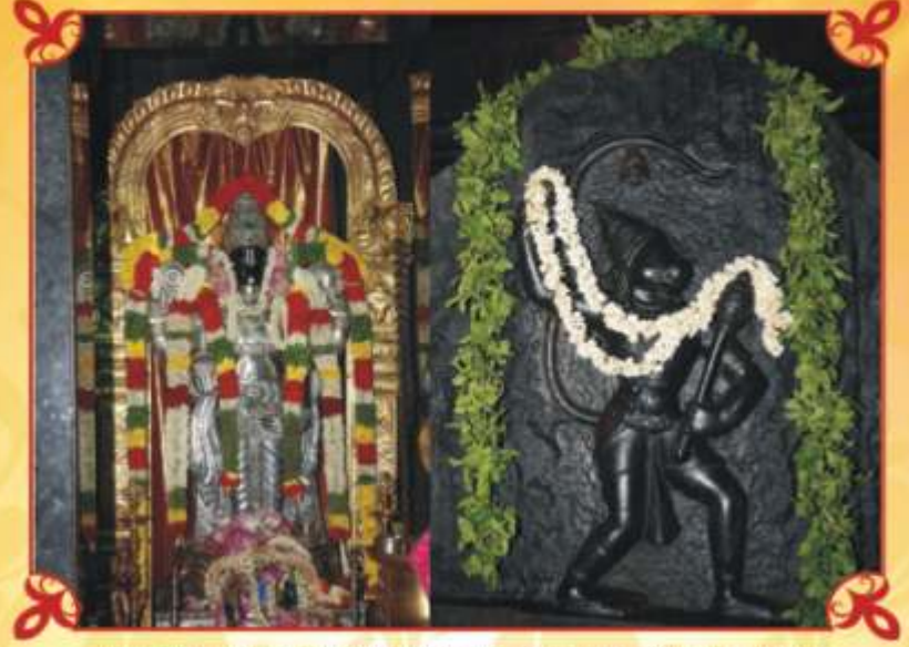
மஹாரண்யம் ஸ்ரீகல்யாணஸ்ரீனிவாச பெருமான், வீர ஆஞ்சநேயர்