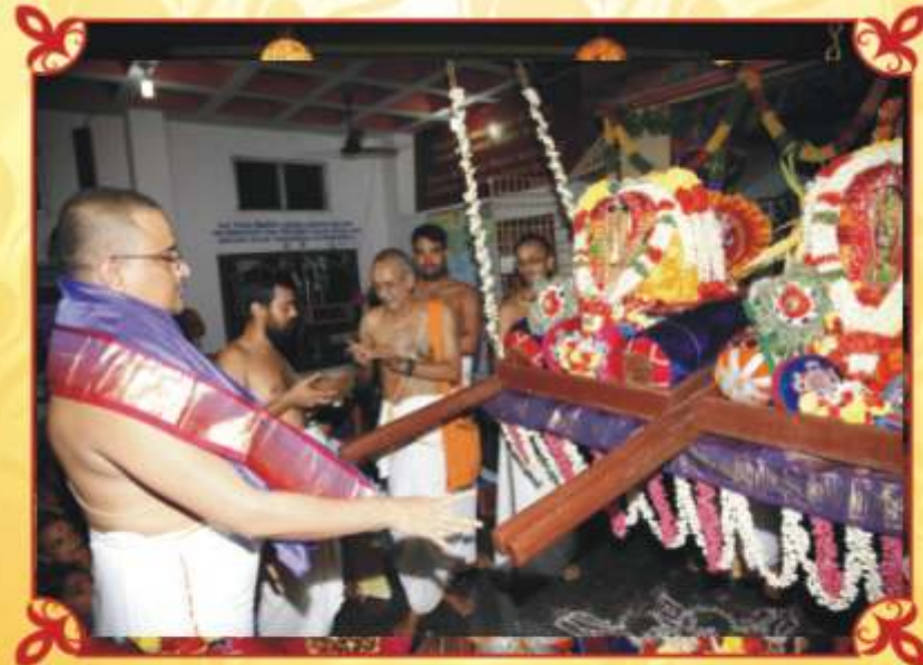
திவ்யதம்பதிகள் ஊஞ்சலில் - ஜானவாசத்தன்று - 8/9/2010