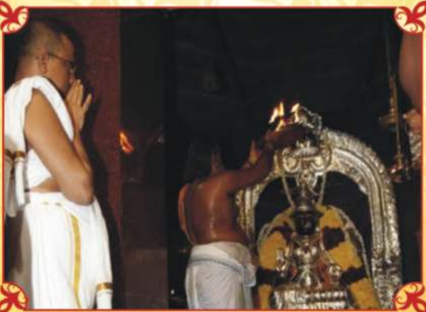
12/9/2010 சென்னை பாரதிநாசன் காலன் புவனேஸ்வர் அம்மன் கோவில்ல்