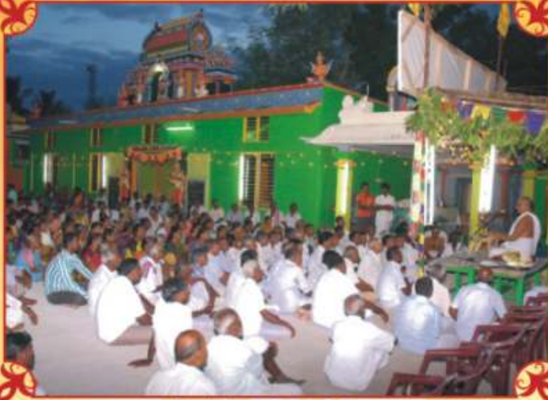
ஆகஸ்டு 26 -தமரைப்பாக்கம் - ரங்கநாதர் தியானமண்டபம் திறப்பு விழா