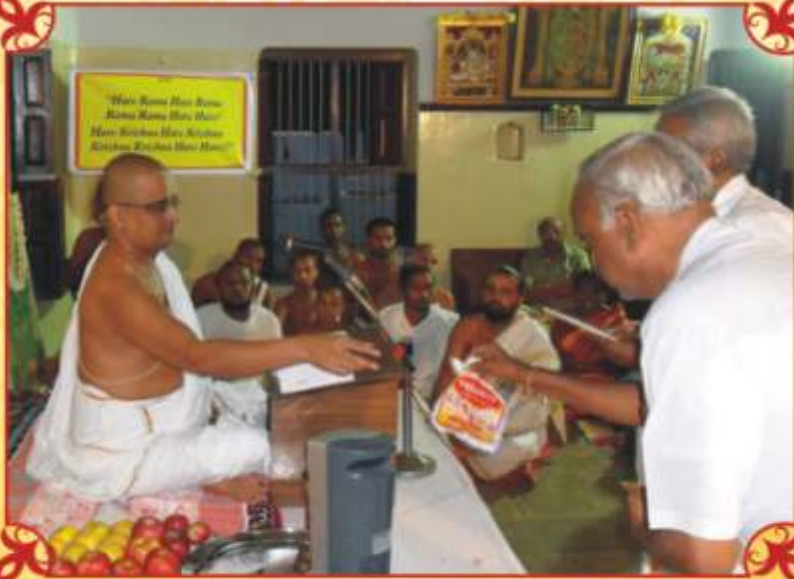
ஆகஸ்டு 30 - திருச்சி நமதீவார் ஓளுங்க்கணைப்பாளர்கள் சந்திப்பு