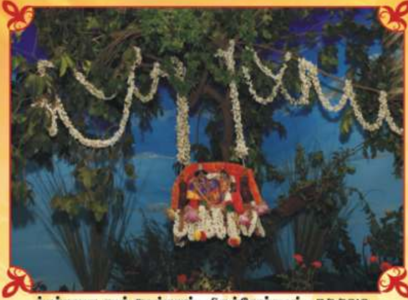
புத்தாண்ட குழல் அலங்காரம் - நகுஞ்சோதஸவம் - 7/9/2010