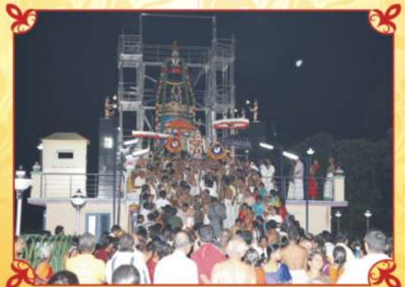
மஹாரண்யம் ஜய ஹனுமான் -உதஸவத்தின்வொழுது