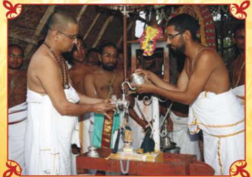
மதுராசல மலை மீது கோவ்ந்த பட்டாபீஷைகம் - 5/9/2010