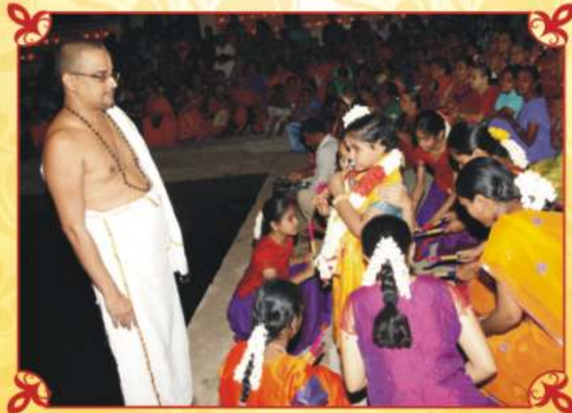
தெப்போத்ஸவத்தின்வொருது - 9/9/2010